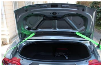
マツダロードスター