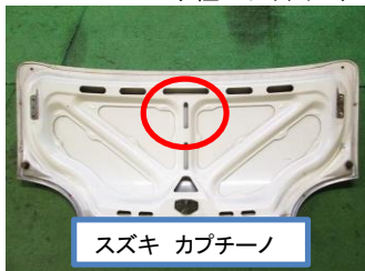
スズキ カプチーノ

滑落防止ベルトを固定する為に、トランク裏の穴にベルトフックを引っ掛けます。 車種により穴の位置は異なりますので、任意に選択してください。